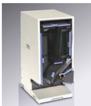
天地表裏反転ユニット