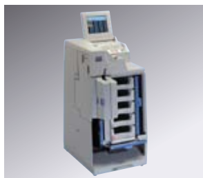
本体 (5段スタッカー)