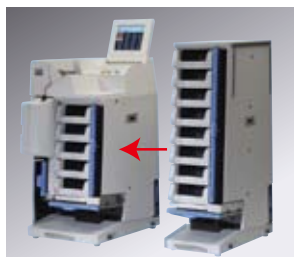
増設ユニットの連結・切り離しが簡単